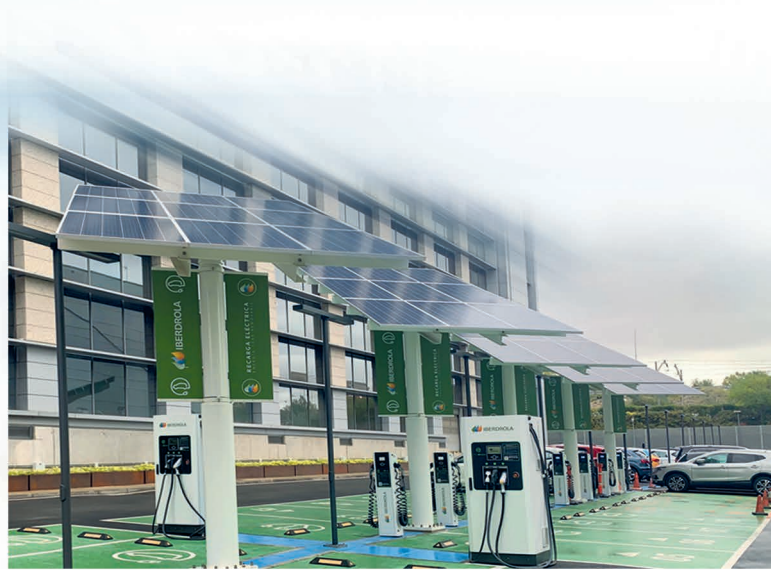
* Existen dos versiones en función de la potencia máxima, Smart DLM y Smart DLM Pro (>45 kW).

El sistema Smart DLM analiza en todo momento la potencia consumida por toda la instalación, puntos de recarga incluidos.